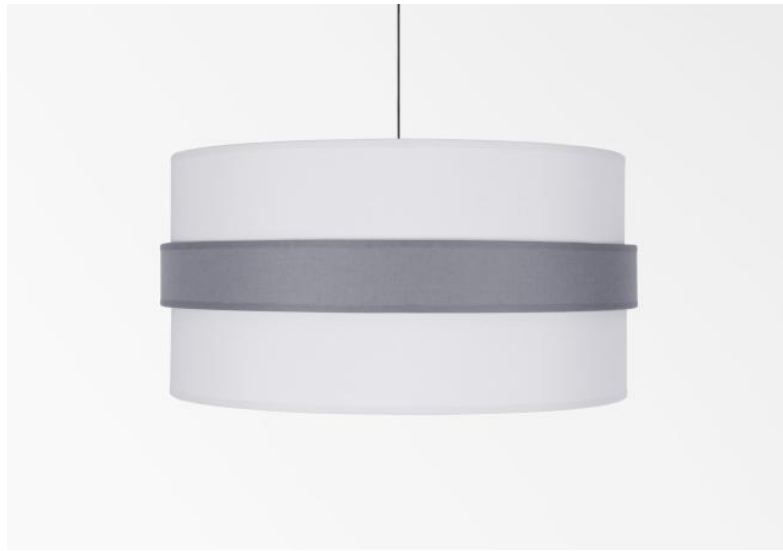
Lampenkap TOUYA 35 in Coton calcaire (stof uit categorie 1) met ring in Coton schiste