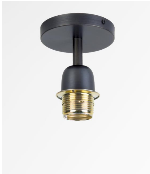
KENTIKA E27 in geborsteld brons