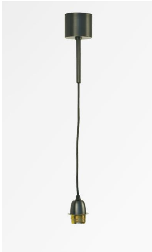
SUSPENSION PAVILLON in geborsteld brons