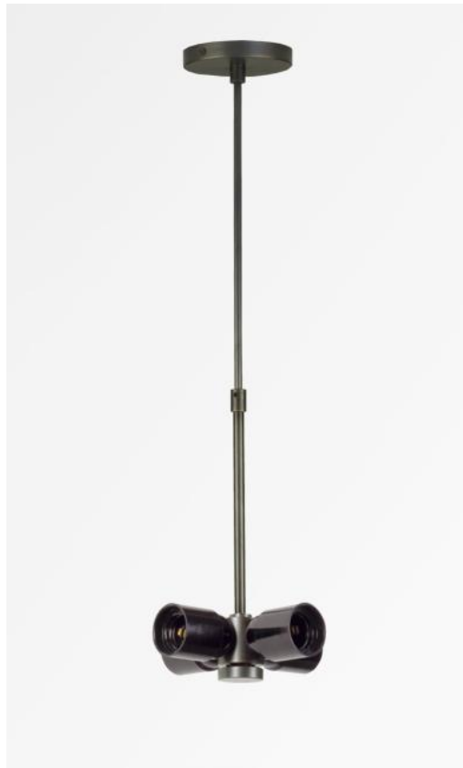
SUSPENSION o TUBES NOURRICE in geborsteld brons