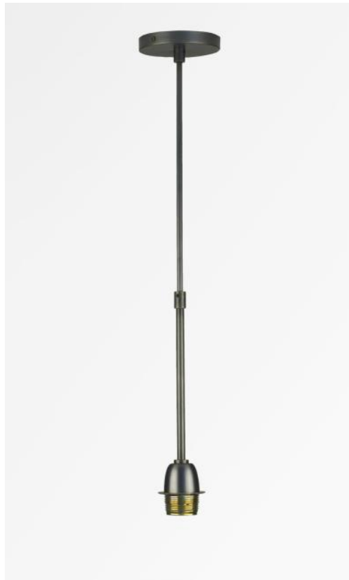
SUSPENSION o TUBES in geborsteld brons