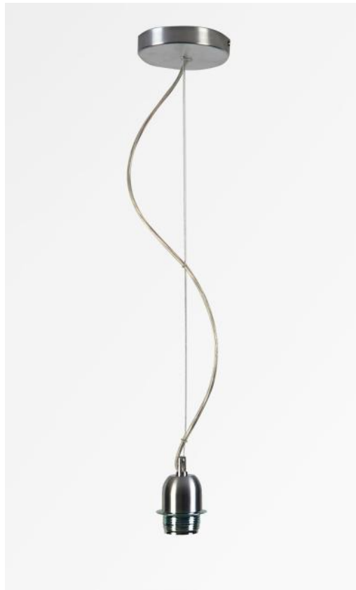
SUSPENSION STEEL CABLE in gesatineerd nikkel