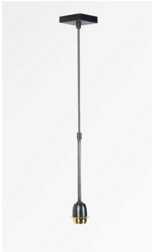
SUSPENSION # TUBES in geborsteld brons