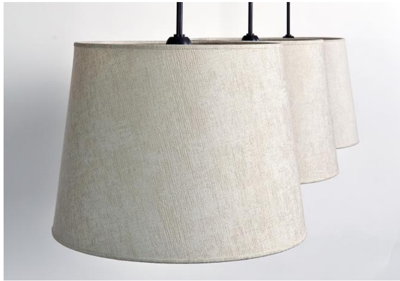
Drie ronde lampenkappen MEREROUKA o40 in Trento Jute (stof uit categorie 3)