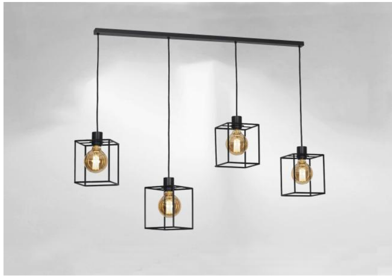
KERMA L 4 in geborsteld brons met structuren in zwarte epoxy afwerking