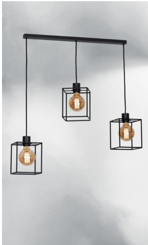
KERMA L 3 in geborsteld brons met structuren in zwarte epoxy afwerking