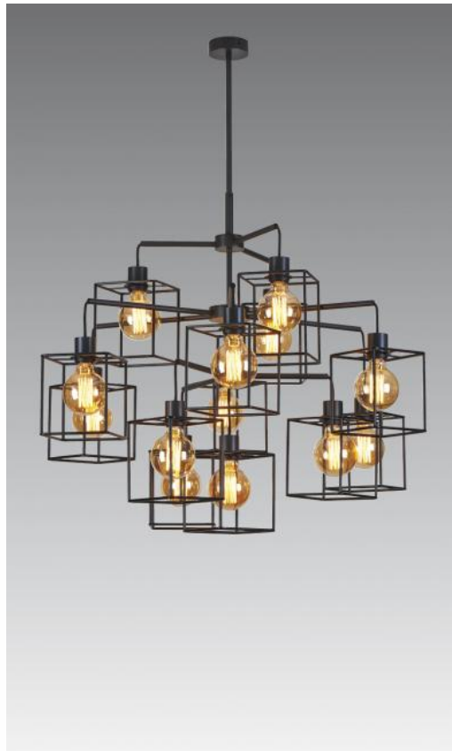
KERMA LUSTRE in geborsteld brons met structuren in zwarte epoxy afwerking