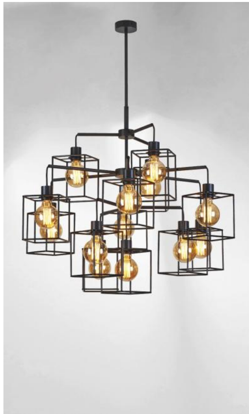
KERMA LUSTRE in geborsteld brons met structuren in zwarte epoxy afwerking