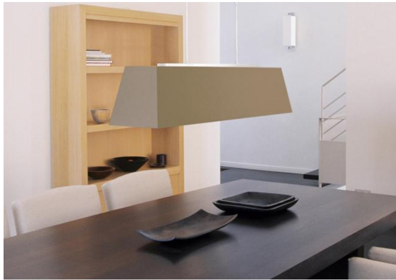
HENOUTMIRE 3 in gesatineerd chroom met lampenkap LARGE in Seta Taupe (stof uit categorie 3)