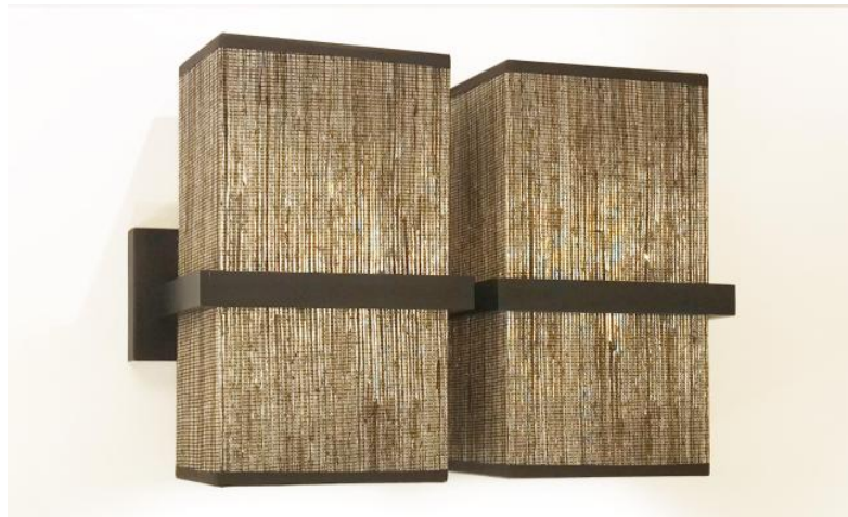
TETI 2 In geborsteld brons met twee rechthoekige lampenkappen in Jacinthe Miel Noir (materiaal uit categorie 5)