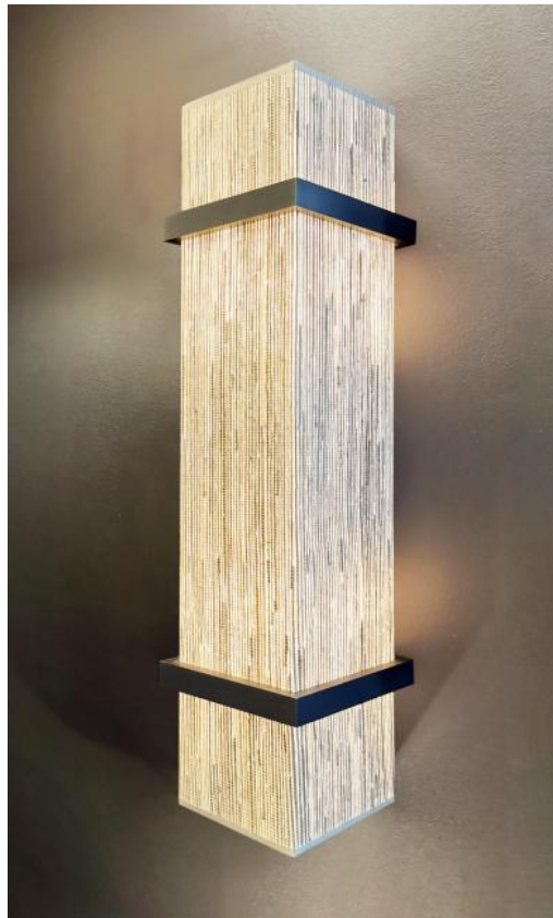
THOT 1 in geborsteld brons met lampenkap in Jacinthe Naturelle (materiaal uit categorie 5)