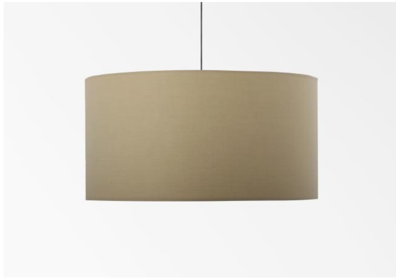
Lampenkap KENTIKA 35 in Coton Chamois (stof uit categorie 1)