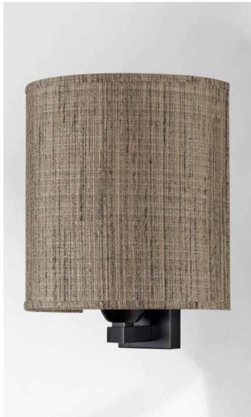
AMADA in geborsteld brons met lampenkap in Turda Châtain (stof cat.3)