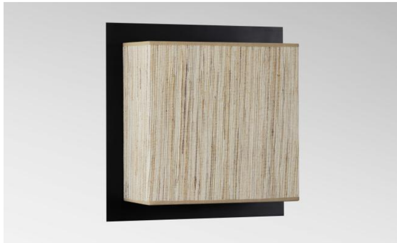
DEIR 2 in geborsteld brons met lampenkap in Jacinthe Naturelle (materiaal uit categorie 5)