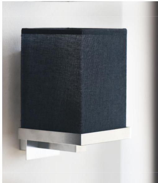
DAKKA in gesatineerd chroom met lampenkap in Maille Fumée (stof uit categorie 1)