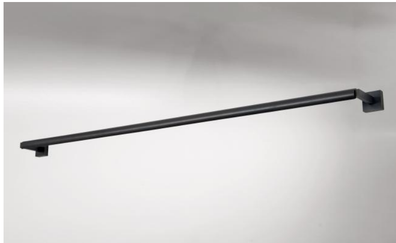
CREMONE 125 in geborsteld brons. Metaal afwerking code: 29