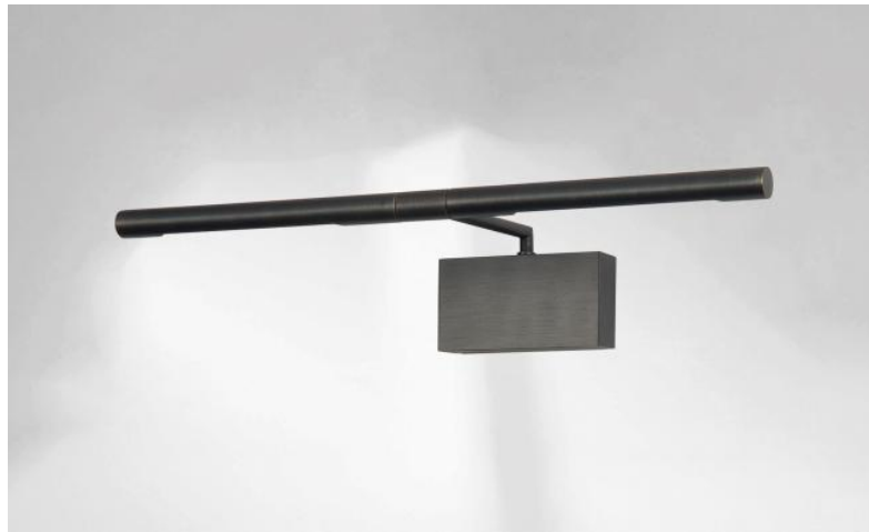
MEROE 40 in geborsteld brons. Metaal afwerking code: 29