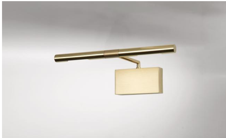
MEROE 25 in messing (gepolijst en gesatineerd). Metaal afwerking code: 20