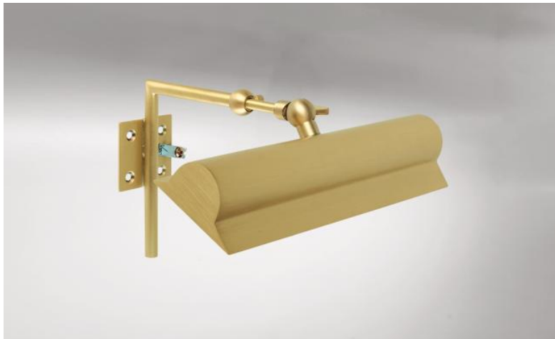
ET 22 in gesatineerd messing. Metaal afwerking code : 25