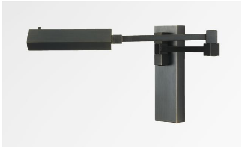
VESTA -SW in geborsteld brons. Metaal afwerking code: 29