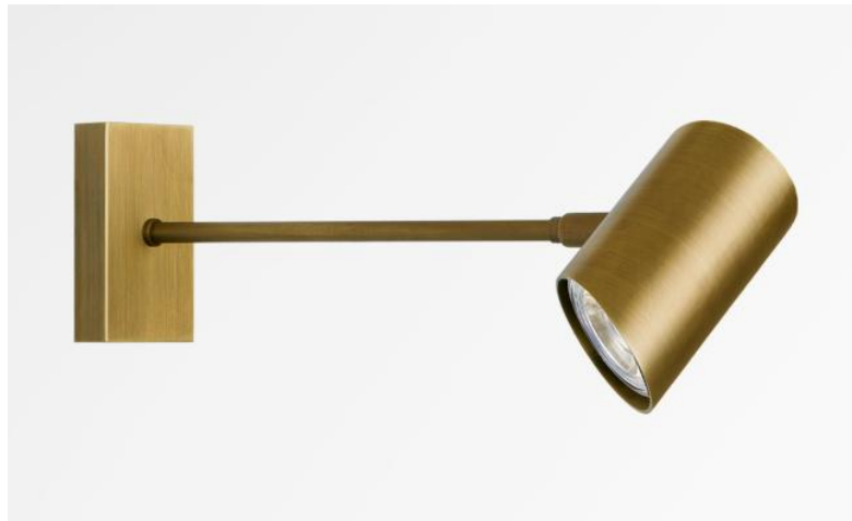
PALMA in lichtbrons. Metaal afwerking code: 28