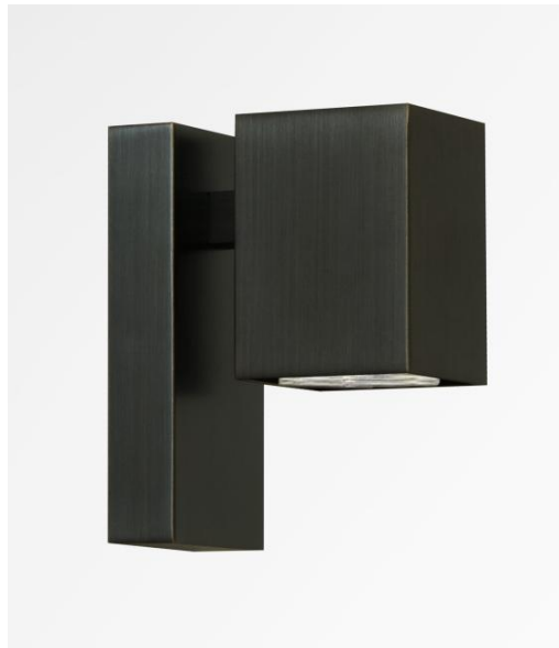
GAMMA 1 in geborsteld brons. Metaal afwerking code: 29