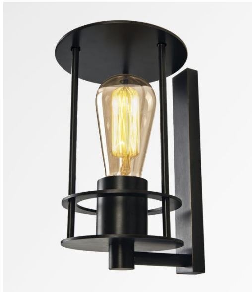
MARINER in geborsteld brons