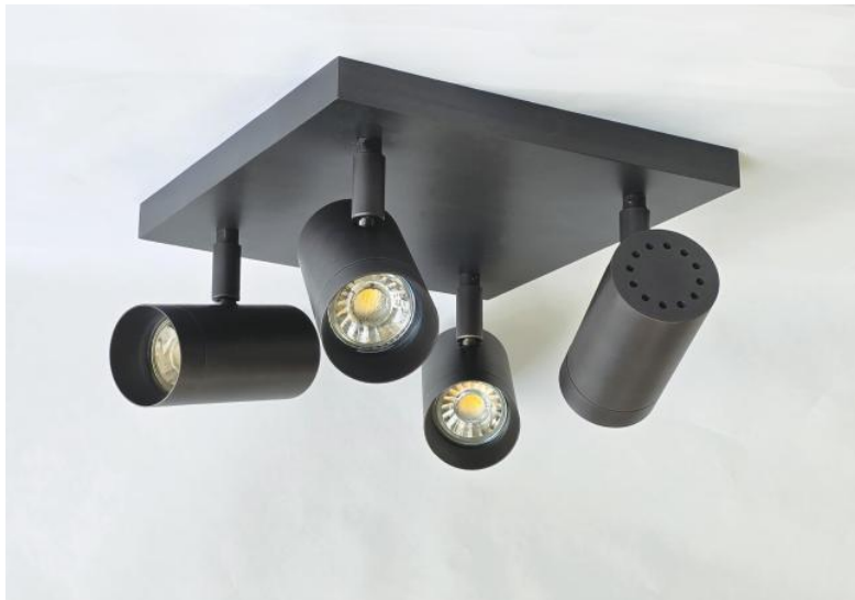
LUNGO SQUARE en bronze griffé. Finition du métal : code 29