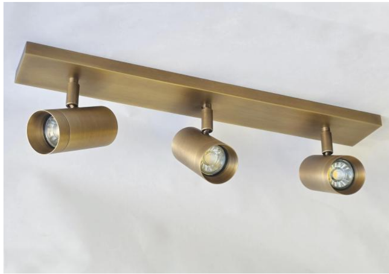
LUNGO 3 en bronze léger. Finition du métal : code 28