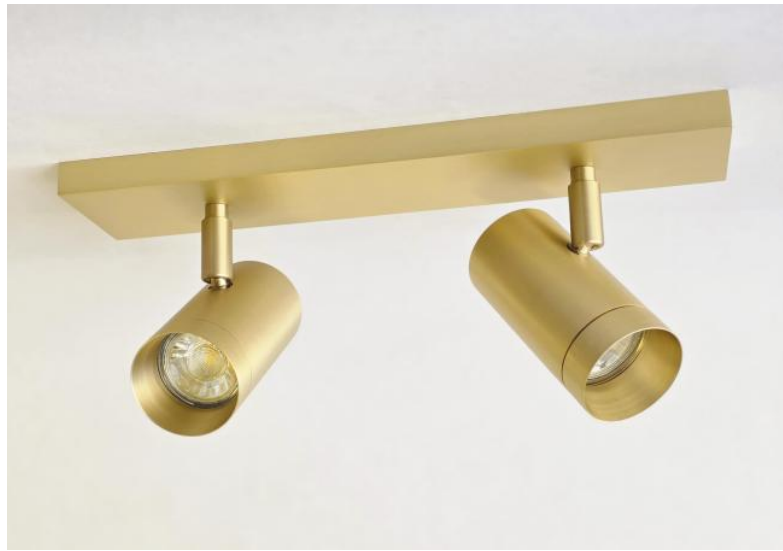
LUNGO 2 en laiton satiné. Finition du métal : code 25