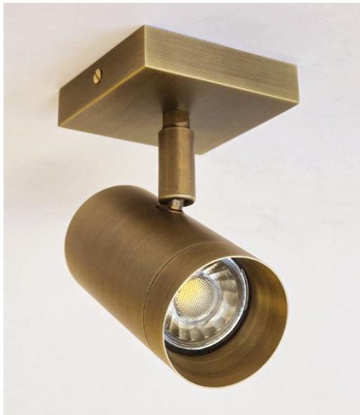
LUNGO 1 en bronze léger. Finition du métal : 28