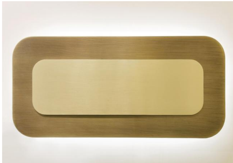
FUMIO en bronze léger et laiton satiné. Finitions du Métal : code 85