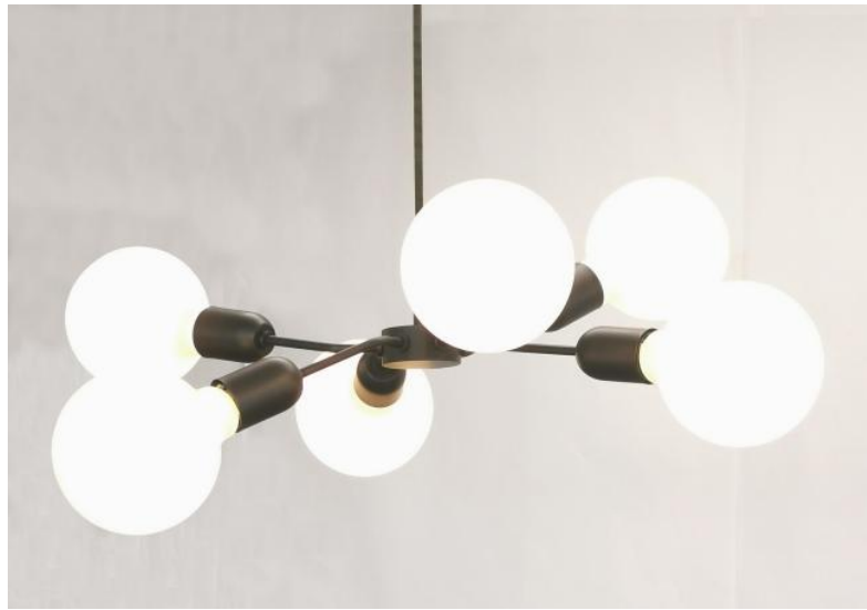
POLPO 1 en bronze griffé avec ampoules soft. Finition du métal : code 29