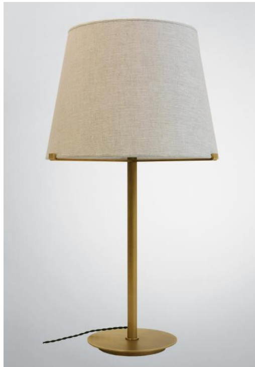
MALMÖ 2 o en bronze léger avec abat-jour conique en Lin Moscou (tissu de catégorie 2)