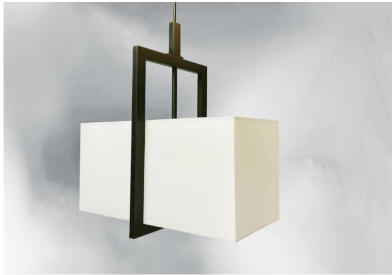
METELIS 45 en bronze griffé avec abat-jour rectangulaire en Chinette Ivoire (tissu de catégorie 0)