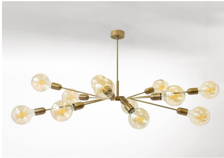
POLPO 2 en bronze léger. Finition du métal : code 28