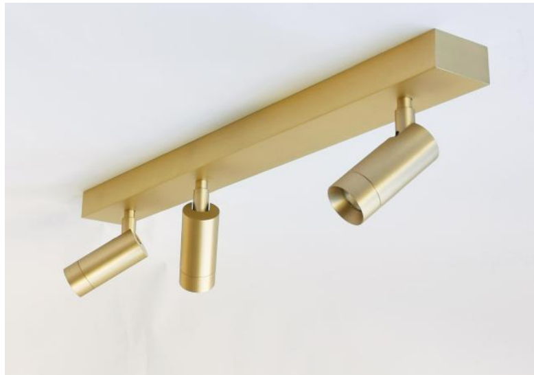
ALTA 3 en laiton satiné. Finition du métal : code 25