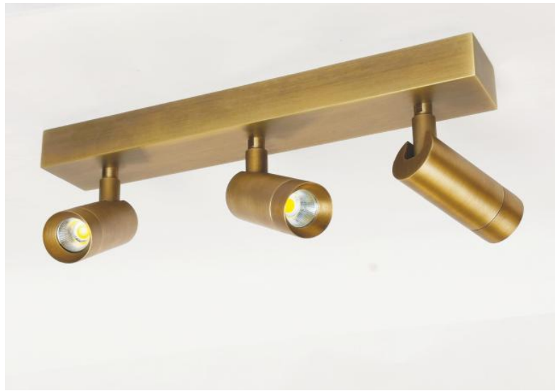
ALTA 3 en bronze léger. Finition du métal : code 28