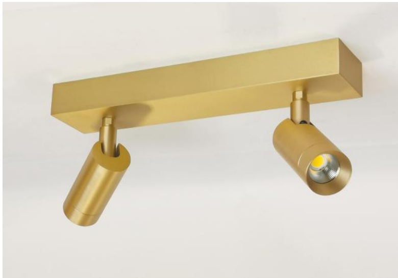
ALTA 2 en laiton satiné. Finition du métal : code 25