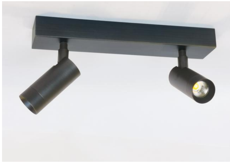
ALTA 2 en bronze griffé. Finition du métal : code 29