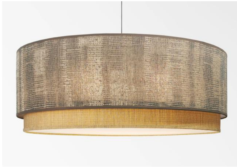
Abat-jour KOUBAN 70 en Wilg Wengé (tissu de catégorie 4) avec anneau en Turda Abricot