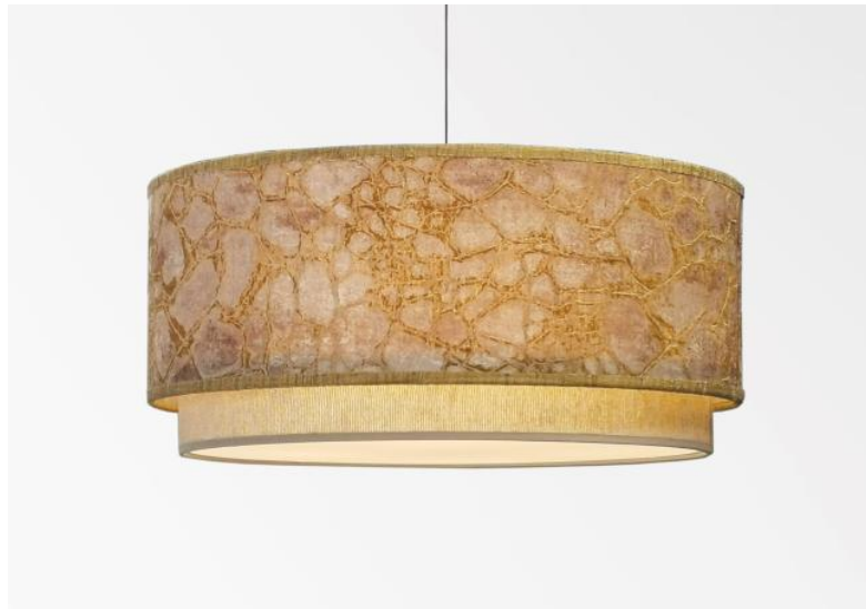
Abat-jour KOUBAN 45 en Tilia Amadou (tissu de catégorie 5) avec anneau en Turda Abricot