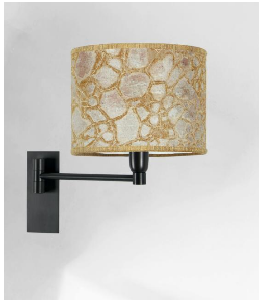
SOKARIS -SW en bronze griffé avec abat-jour en Tilia Amadou (tissu de catégorie 5)