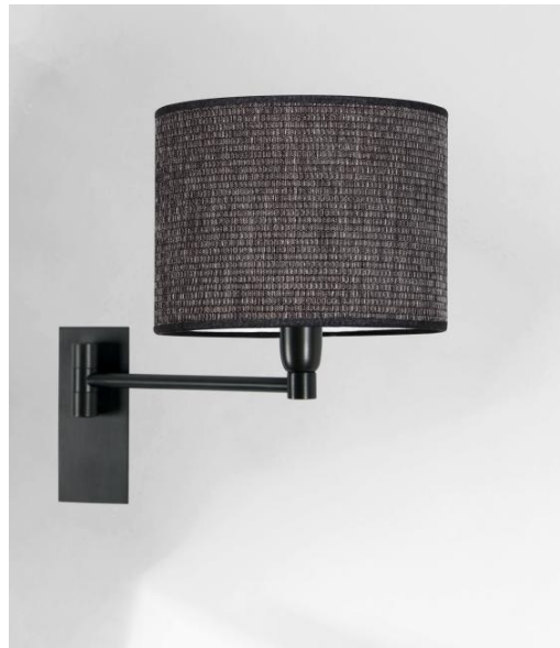
SOKARIS +SW en bronze griffé avec abat-jour en Parma Réglisse (tissu de catégorie 4)