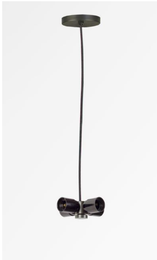
SUSPENSION o NOURRICE en bronze griffé