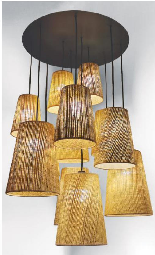
SIMBA 12 o58 en bronze griffé avec abat-jour en Raphia Nature et Raphia Banane (matières de catégorie 3)