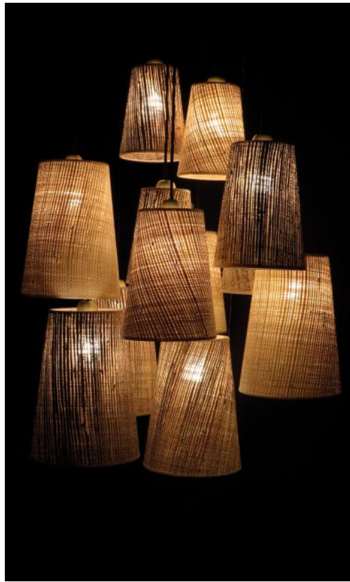
SIMBA 12 o58 en noir structuré/laiton satiné avec abat-jour en Raphia nature et Raphia banane (tissus de catégorie 3)