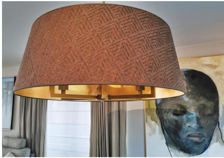
TOURAH 6 LARGE en bronze léger avec abat-jour Ø90cm en Arrow Casamance (tissu de catégorie 4) avec intérieur en Or Feuilles