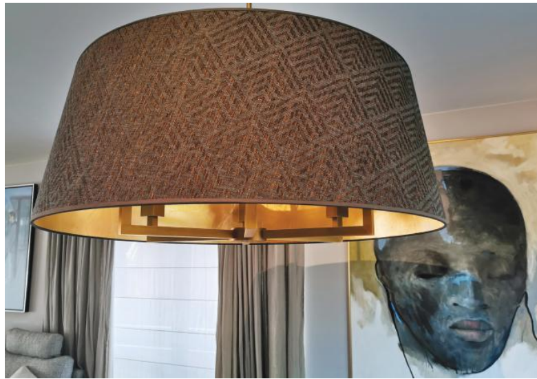
TOURAH 6 LARGE en bronze léger avec abat-jour Ø90cm en Arrow Casamance (tissu de catégorie 4) avec intérieur en Or Feuilles