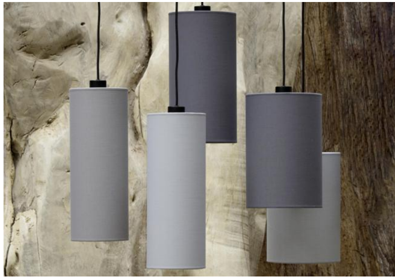
ZIBAL 5 en bronze griffé avec abat-jour en Coton Gris, Tourterelle et Schiste (tissus de catégorie 1)