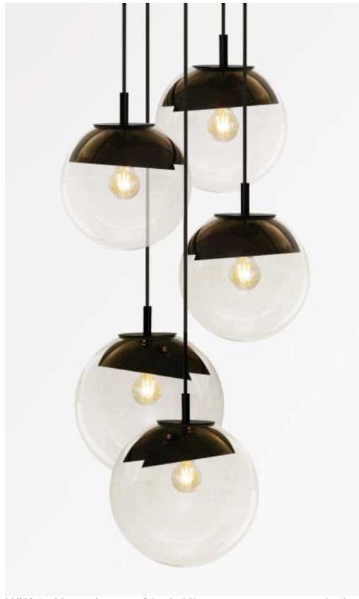
LUNA 5 o26 en noir structuré (code 02) avec verres transparents (code 80)