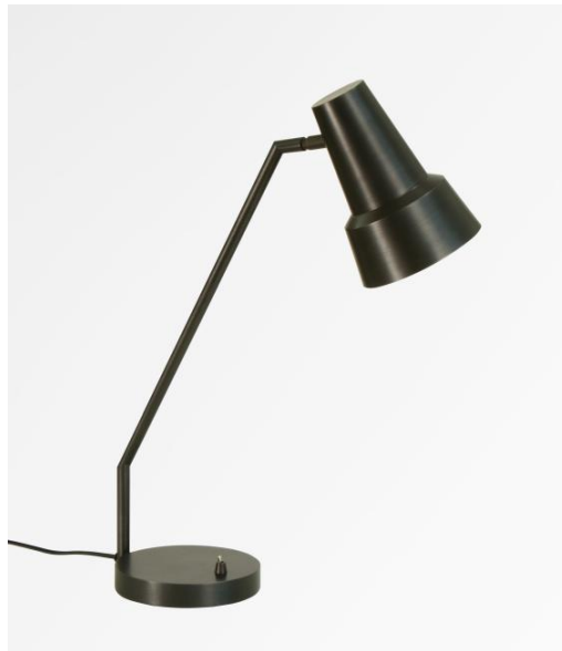
SEVILLA en bronze griffé. Finition du métal : code 29