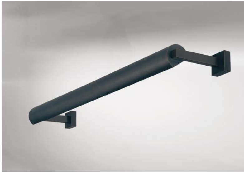
ALEXANDRIE 50 en bronze griffé. Finition du métal : code 29