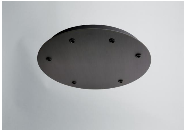
CEILING BASE 6 o30 en bronze griffé. Finition du métal : code 29. En option : un grand choix de câbles et de douilles (+supplément)